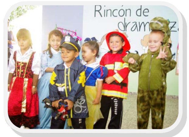
Unser Kindergarten bei der Eröffnung der Spielecken

In Honduras ist eine Berufsausbildung, wie wir sie in der Schweiz und in Deutschland kennen, wenig verbreitet. Dementsprechend klein ist das Angebot an zur Verfügung stehenden Lehrplätzen. Bei uns erhalten 250 Auszubildende die Möglichkeit, einen Beruf zu erlernen. Wir sind landesweit eines der grössten Ausbildungszentren und mittlerweile bekannt in der Gegend. Bei der Bevölkerung und in Industrie und Gewerbe geniessen wir eine hohe Akzeptanz. Unsere Auszubildenden werden von den Praktikumsbetrieben be-