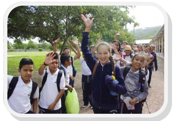
Ausflug in den nahe gelegenen Wald

„Unsere Auszubildenden werden von den Praktikumsbetrieben bevorzugt aufgenommen und etliche von ihnen werden später im gleichen Betrieb gar angestellt.“