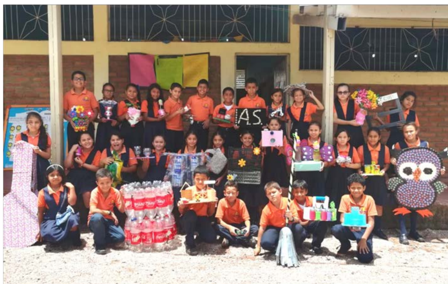
Die vierte Klasse beim Recycling-Projekt

Wie heisst es doch? «Von nichts kommt nichts» – und so ist es auch in Honduras. Wir sind fest davon überzeugt, dass jemand, der tüchtig ist, und es zu etwas bringen möchte, auch in