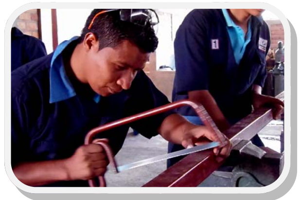
Auszubildender in der Schweisser Werkstatt

„Es ist in der Tat nicht einfach, Lehrer zu finden, die gutes Englisch sprechen. Erschwerend kommt hinzu, dass wir ausserhalb der Stadt sind und die Menschen in der Regel nur ungern die urbane Zone verlassen.“