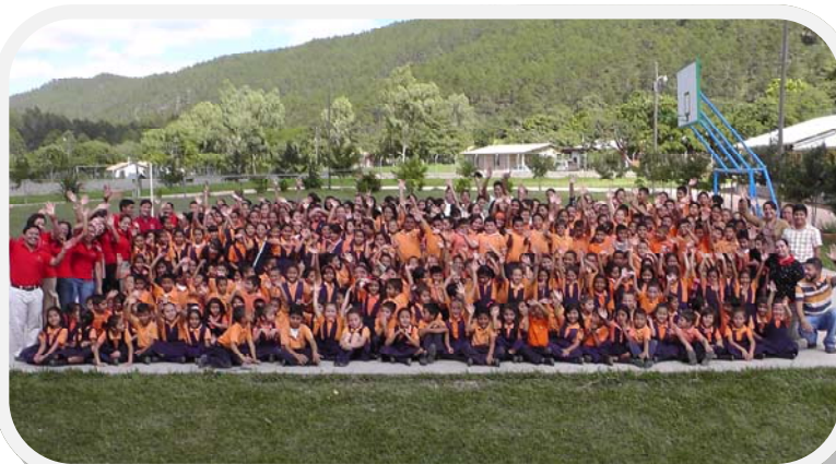
Die Kinder und Lehrpersonal des zweisprachigen Bereiches

Natürlich machen wir uns Gedanken über unsere finanzielle Zukunft. Der Anteil an Eigeneinnahmen muss in Zukunft überproportional wachsen, damit wir unseren finanziellen Verpflichtungen nachkommen können. Aus diesem Grunde vergrössern wir in den kommenden Jahren unseren zweisprachigen Bereich kontinuierlich. Ab