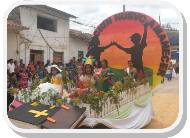
Umzug am Unabhängigkeitstag

Wir bieten zurzeit 6 Ausbildungsbereiche an: Informatik, Friseur und Körperpflege sowie Schweißen, Industriemechanik, Automechanik und Bäcker/Konditor. Die grösste Nachfrage verzeichnen die Bereiche Automechanik und Informatik. Zurzeit finden für einige Berufe gerade die Abschlussprüfungen statt. Die ersten Resultate sehen erfolgsversprechend aus. In Automechanik haben von den 40 Auszubildenden im ersten Lehrjahr alle bestanden. Ebenfalls haben alle Bäcker und Konditoren erfolgreich abgeschlossen. Weitere Bereiche beginnen demnächst mit der Abschlussprüfung. Wir gehen davon aus, dass die staatliche Ausbildungsbehörde in diesem Jahr die Zahlungen, zwar mit einiger Verspätung, aber grundsätzlich wie