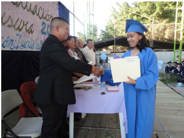
Entrega de diplomas