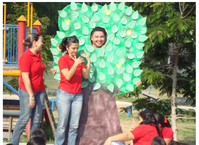
Los maestros presentan un drama