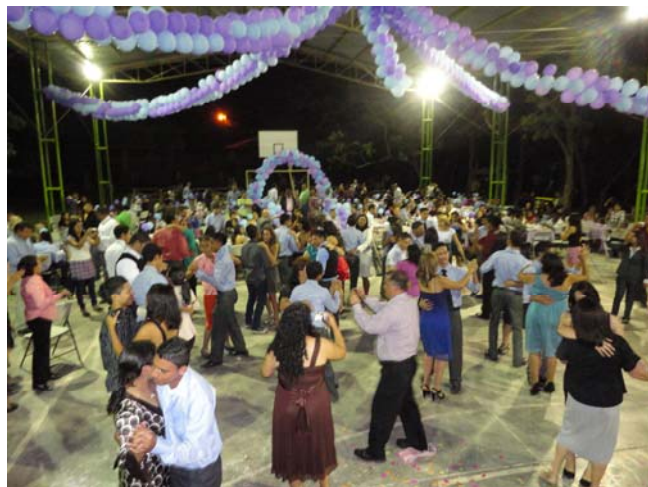
El baile final