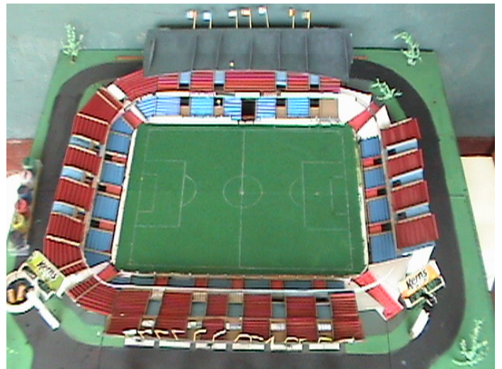
Estos son unos proyectos que fueron presentados por los alumnos