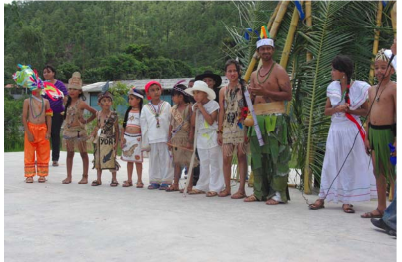
Elección del indio mas típico