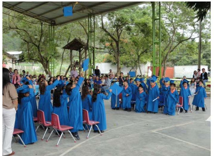
Invitados de la mesa principal entregan diplomas