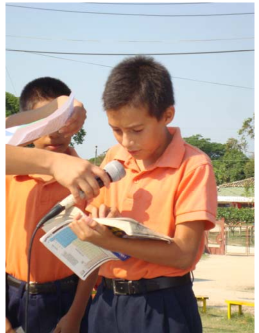
Aprendiendo nuevas palabras