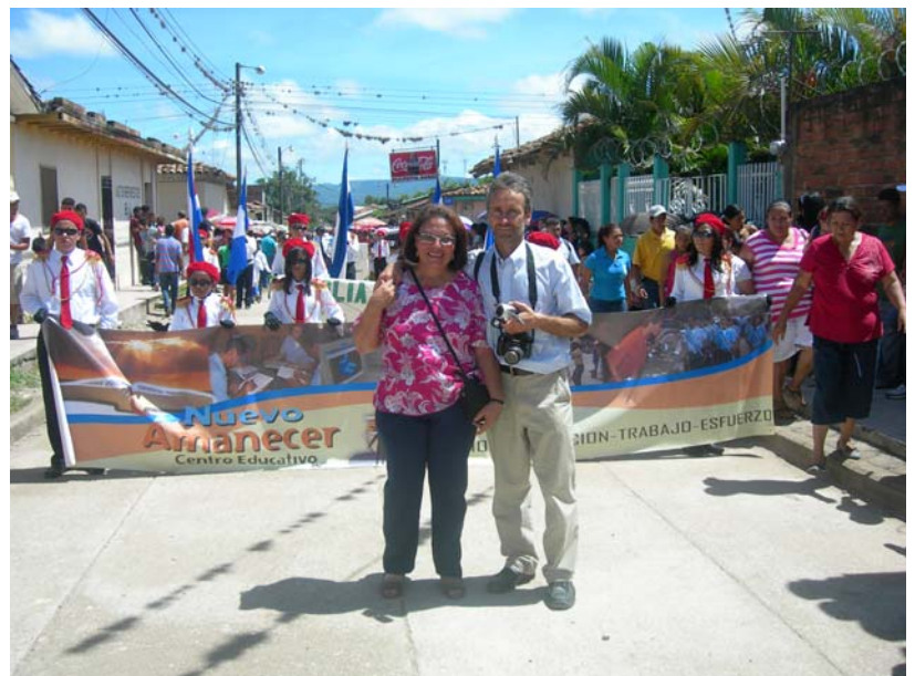
Los cadetes marchando