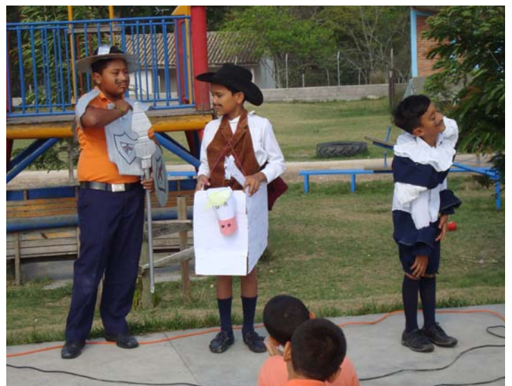
Presentación de Don Quijote de la Mancha