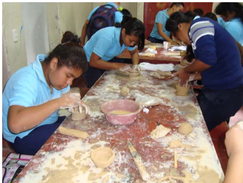
Enseñanza de manualidades