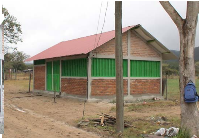
La nueva caseta en la escuela bilingüe