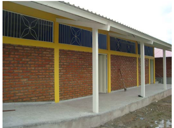
Las nuevas aulas patrocinadas por la embajada de Australia